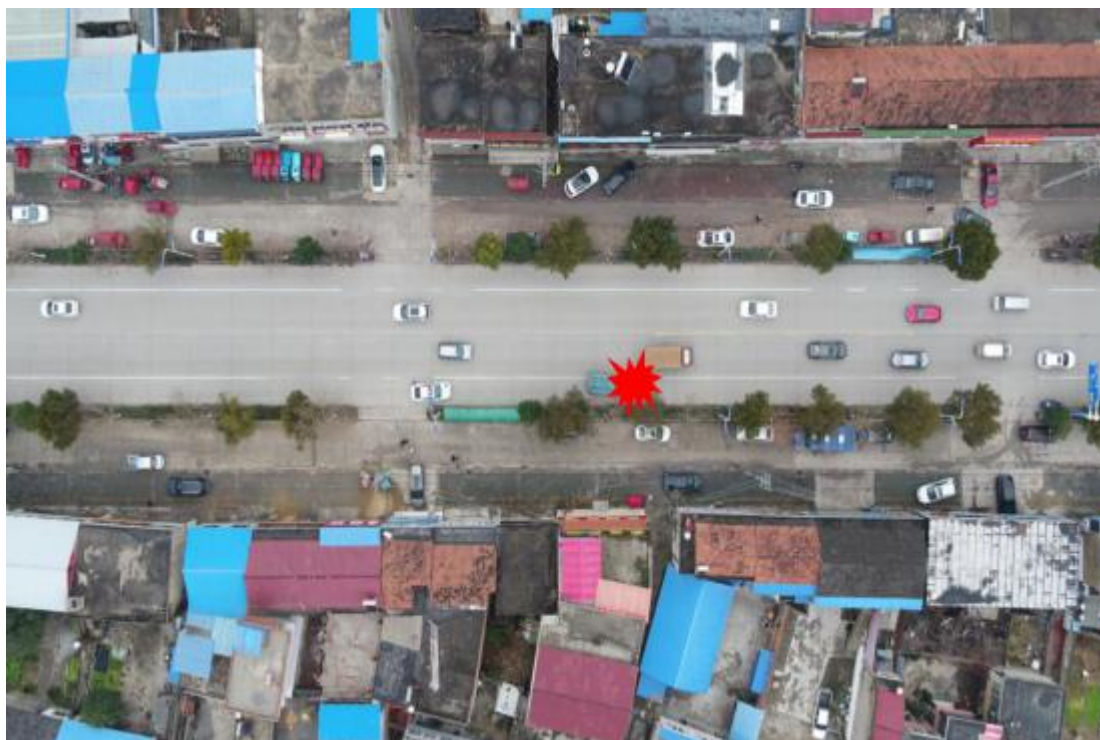
图 5 事故路段道路情况

为解决违停导致的道路拥堵，安丰镇人民政府按照寿县公安局交通管理大队四中队的建议于2020年12月在事发路段公交站台旁安装了“泊位取消禁止停车”标牌。