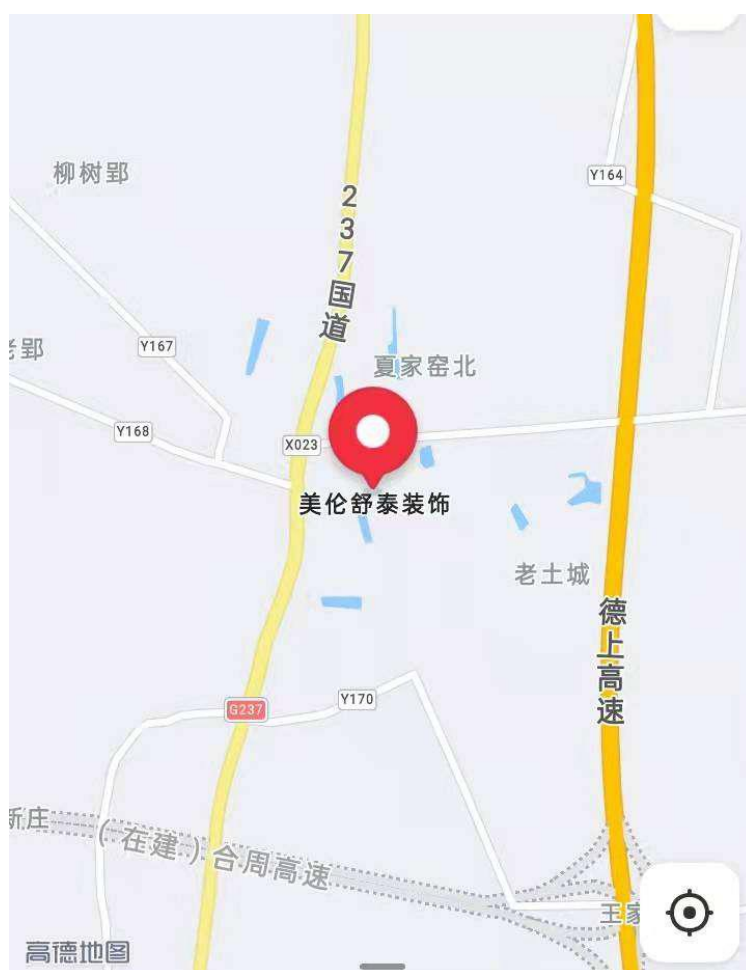
图 1 事故位置图

普通客车沿 237 国道由北向南方向行驶至 237 国道 480KM+800M 处（寿县安丰镇街道北街美伦舒泰装饰门前路段）（见图 1），碰撞到前方同向由安某某驾驶的停放在路边的豫 HQ5356 重型仓栅式货车，造成驾驶员楚某、皖 DG9906 小型面包车内乘员陈某、柏某某、陈某某四人当场死亡及两车受损的道路交通事故（见图 2、3）。