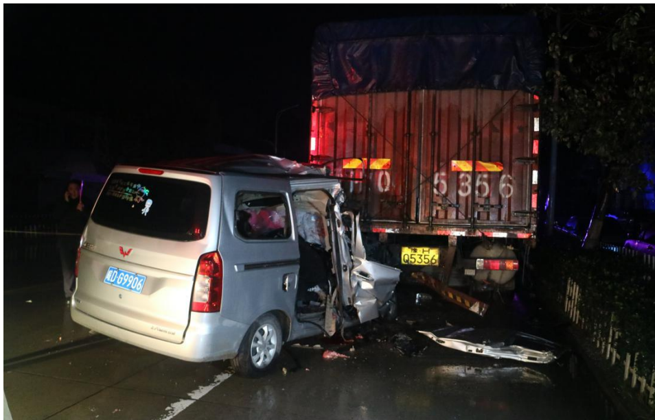
图 3 事故现场图