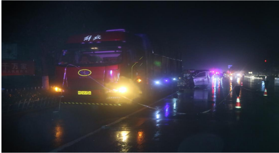
图 2 事故现场图