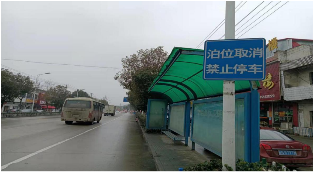
图6事故路段道路情况