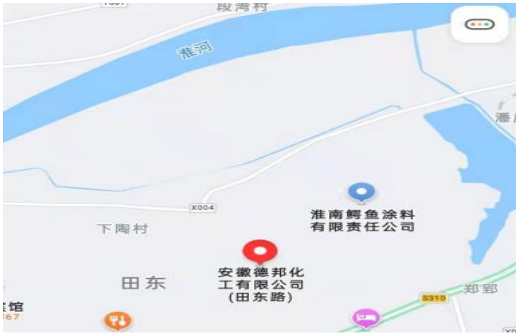
图 1 事故发生地点