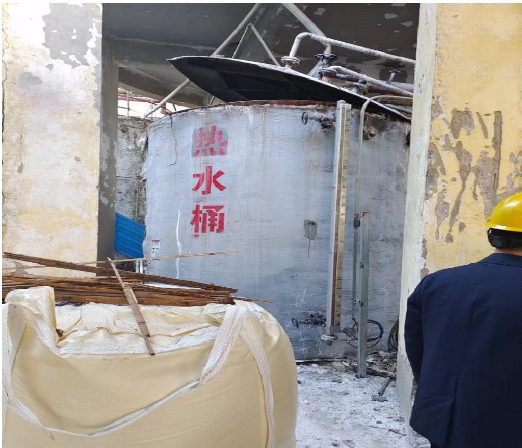
图 2 现场确认事发地点